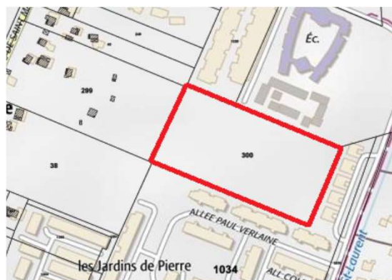
Plan de cadastre