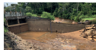
Barrage de Saut-Maripa pendant les travaux

Retrouvez nous sur Facebook et Twitter :