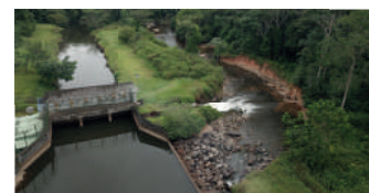
Barrage de Saut-Maripa avant travaux

Cette centrale, maintenant totalement renouvelée et modernisée, sera le moyen de production clé dans le mix énergétique 100% énergies renouvelables de la commune de Saint-Georges de l'Oyapock.